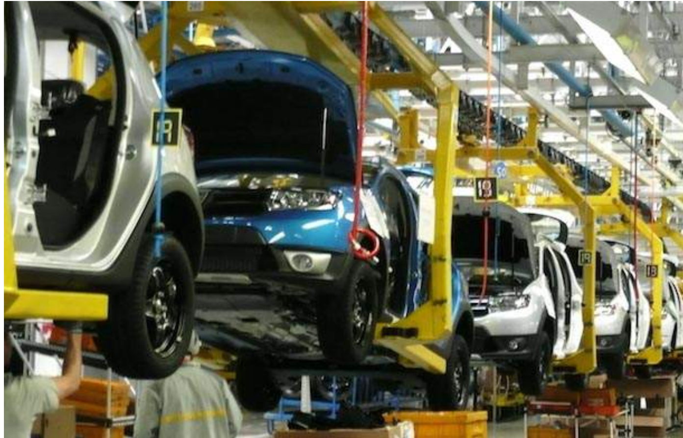
Usine Renault (Maroc)

Changer de sexe, changer de salaire, changer de slip tous les jours.