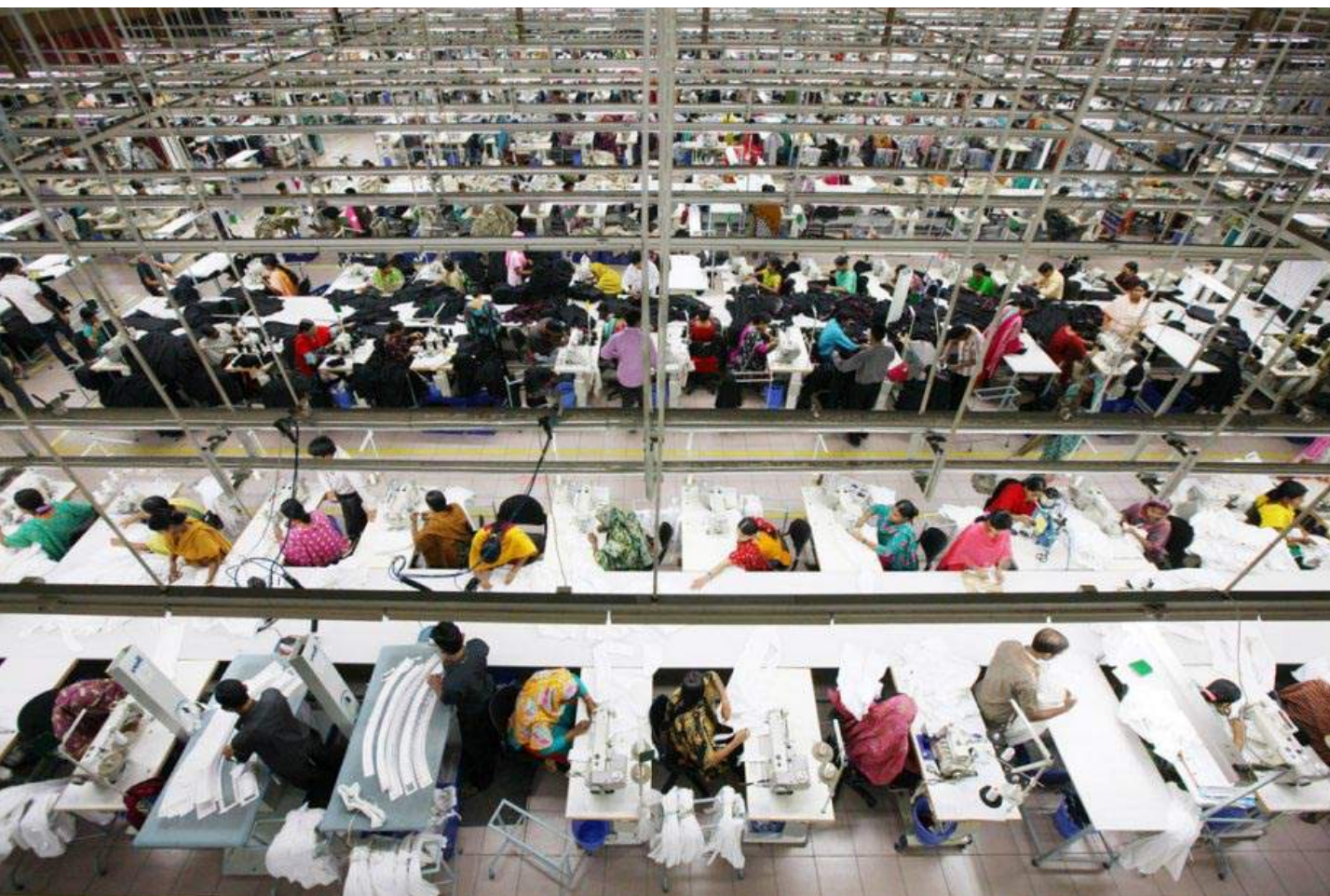
Atelier de couture (Bangladesh)