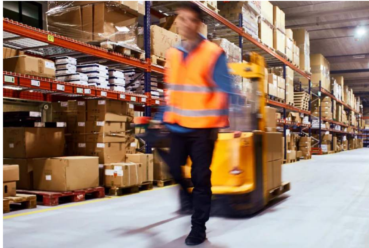
Entrepôt (Canada)

J'imagine une pièce de contact et de frottement entre un poème qui gratte la question du travail, des radios qui se font l'écho du monde, cinq interprètes qui opèrent une mue et dessinent physiquement d'autres manières de se lier, de se soutenir et de prendre soin.