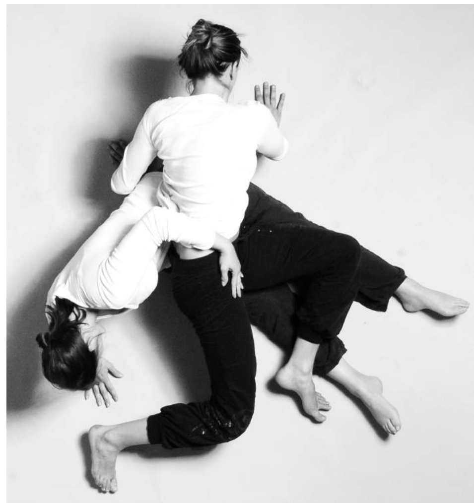
Danse Contact Improvisation

Au moins leurs puissantes facultés à allier concrètement corps et politique .