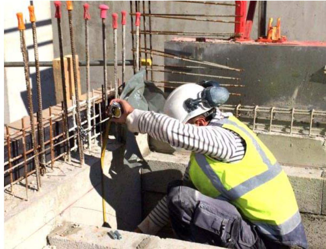
Chantier de construction (Espagne)

Nous nous sommes vite rencontrés et l'envie de creuser ensemble s'est imposée.