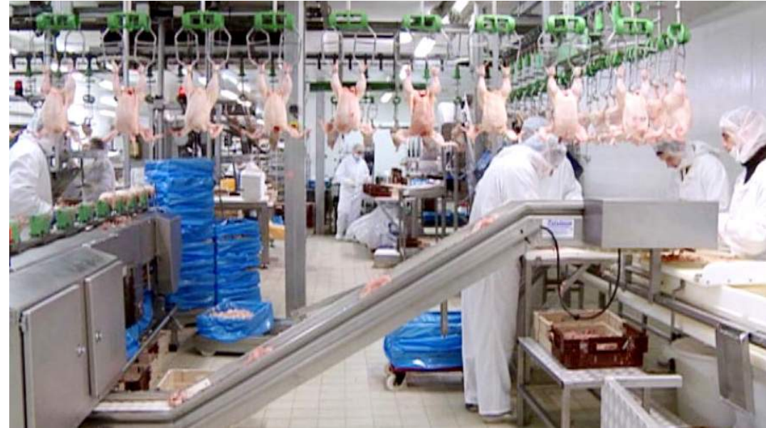
Abattoir (France) - Crédits @ "Entrée du personnel" documentaire de Manuel Frésil, 2011

Elles répondront au poème autant qu'elles apporteront d'autres timbres, d'autres humeurs, d'autres réalités, d'autres contextes, d'autres espaces et d'autres temporalités.