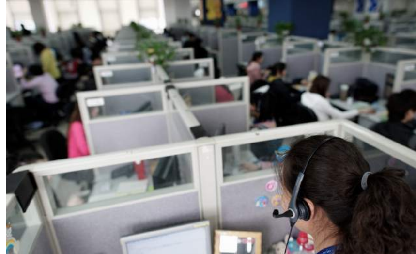
Centre d'appels (Tunisie)