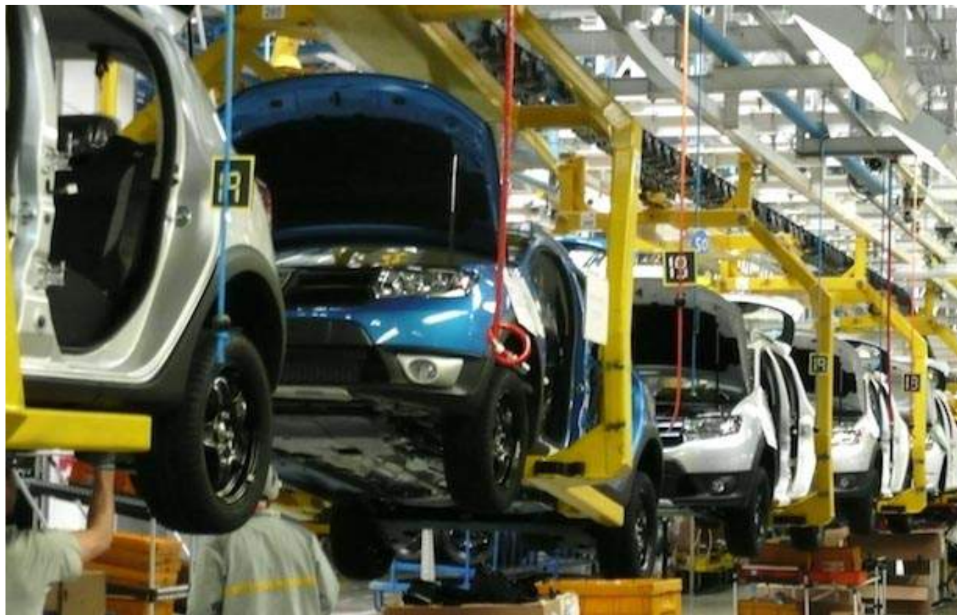
Usine Renault (Maroc)

Changer de sexe, changer de salaire, changer de slip tous les jours.