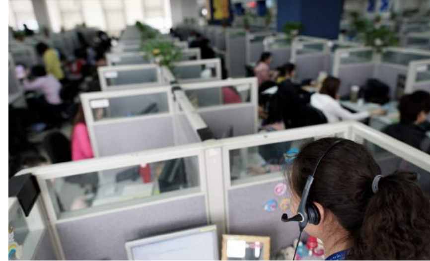
Centre d'appels (Tunisie)