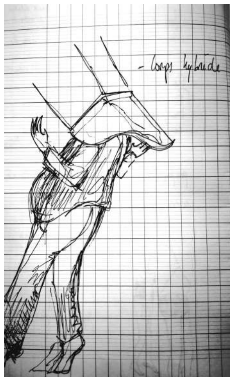
Croquis de Marion Bourdil