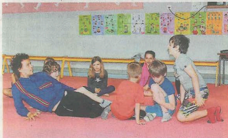
Chaque classe à partir du CP a pu participer à des ateliers.

Samedi 26 mai , à 10 h 30 et 14 h, À l'envers de l'endroit, école Montgolfier, 141, route de Nort-sur-Erdre. Infos et réservations au 02 28 02 22 52 ou sur http://www.hors-saison.fr/billetterie/Tarif unique : 5 €