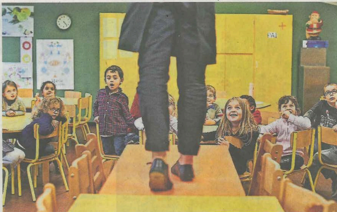
« À l'envers de l'endroit » investit les écoles et les métamorphose le temps d'un spectacle.

Et pour mieux expliquer la démarche aux enseignants, rien ne vaut une conférence dansée ! « C'est une manière de clarifier les choses avec