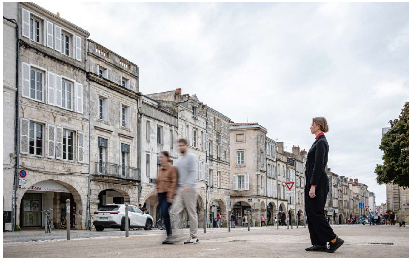
La Traverse // Jeanne Simone