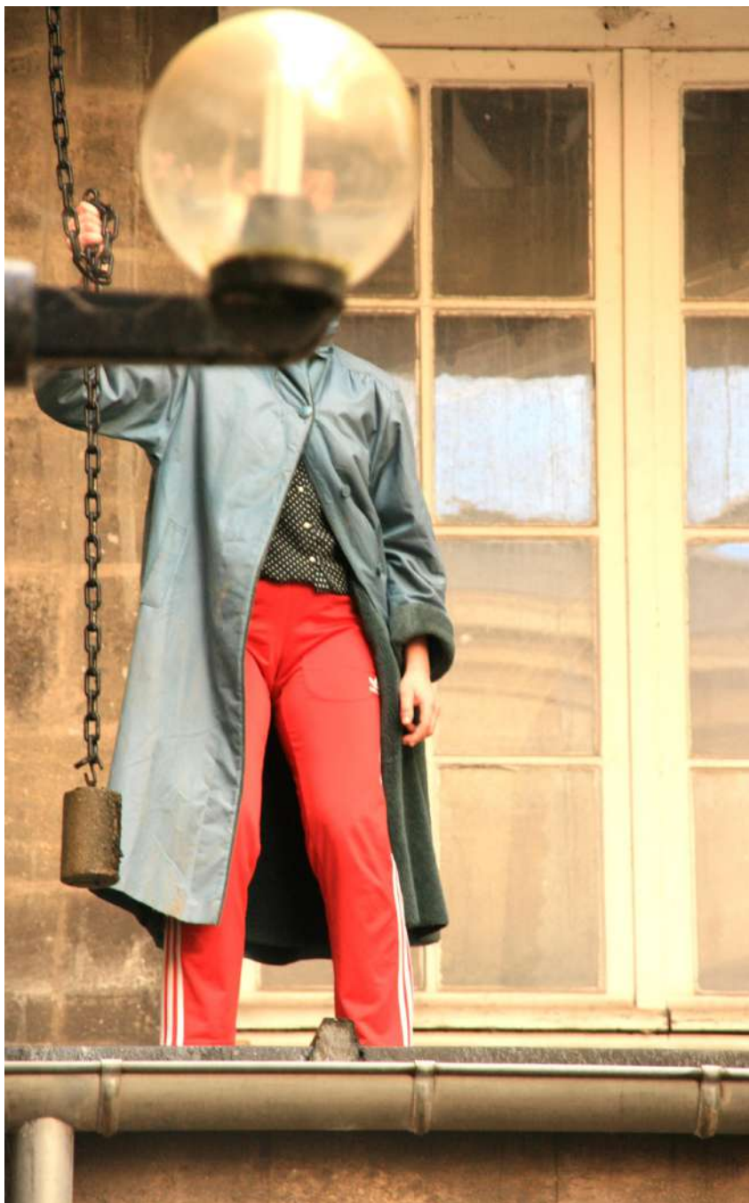
Nos Lieues // Jeanne Simone