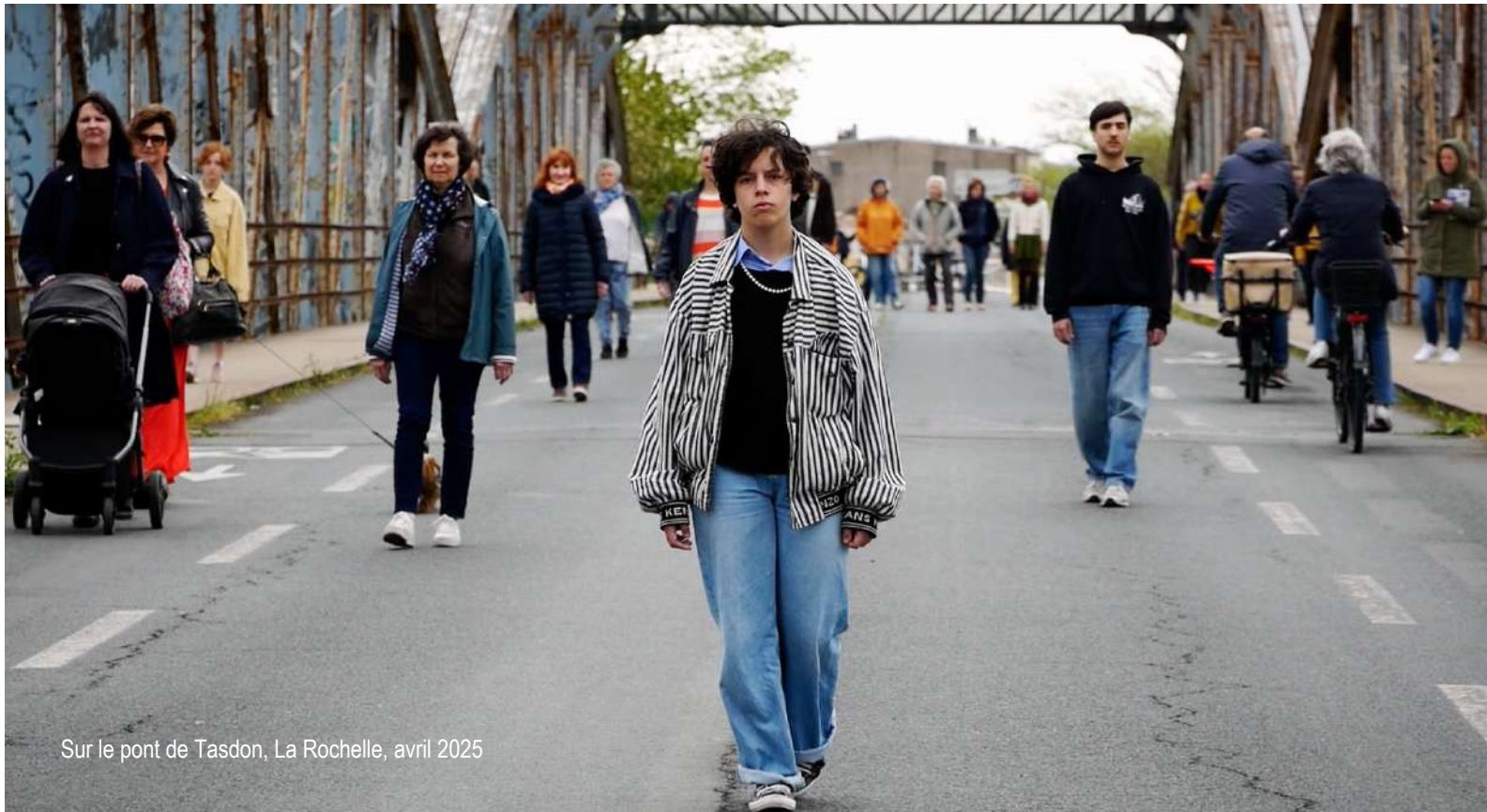
Sur le pont de Tasdon, La Rochelle, avril 2025

La Traverse ne traverse pas de passage clouté, ou de voie passante, pour éviter toute sécurisation excessive induite qui nuirait à la poésie du moment.